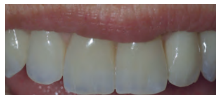
Протез в полости рта пациента