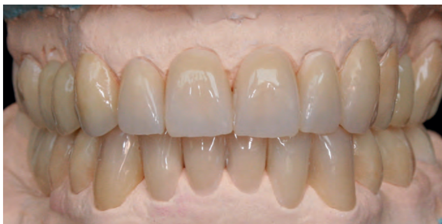
Мост из top.lign professional «топ.лайн профессионал»