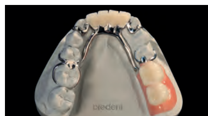
Протез на модели