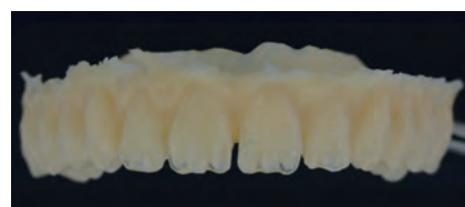
top.lign professional «топ.лайн профессионал» в необработанном виде