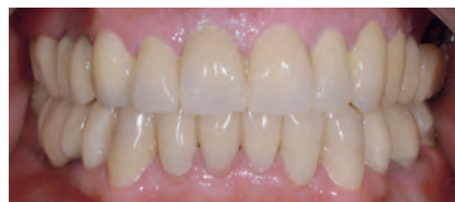
Протез в полости рта пациента