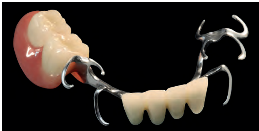
Кламмерный протез из top.lign professional «топ.лайн профессионал» и облицовочных оболочек novo.lign «новолайн»