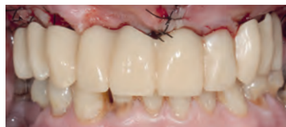
Протез в полости рта пациента