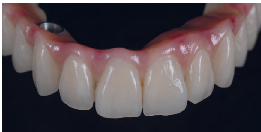
Мост из top.lign professional «топ.лайн профессионал» и обработанной десны, индивидуализирован с помощью crealign «креа.лайн» Изображения: ЗТ Кристиан Далла Либера (ZT Christian Dalla Libera), Падуа, Италия