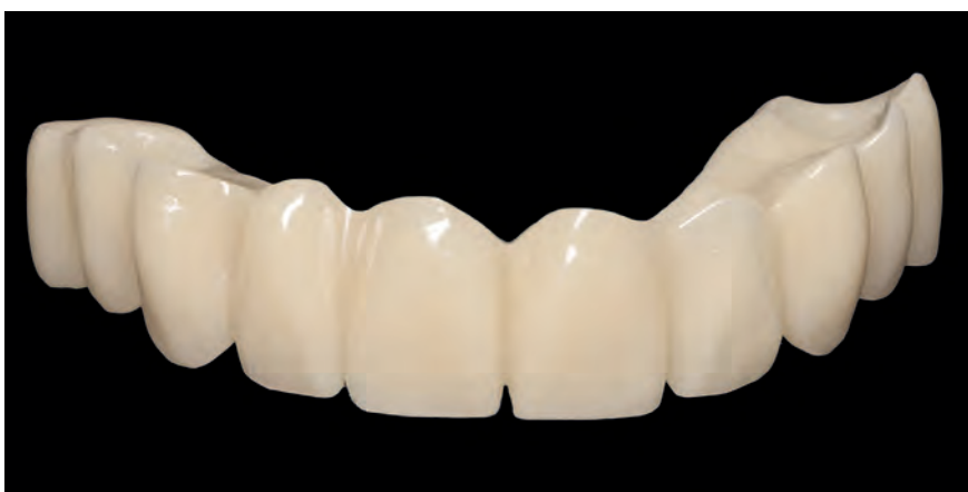
Подлежащий немедленной нагрузке мост, монолитно изготовленный из top.lign professional «топ.лайн профессионал»